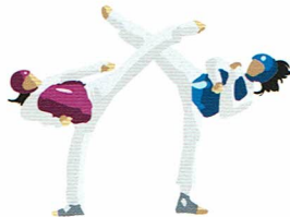
テコンドー (キョルギ(組手)、プムセ(型))